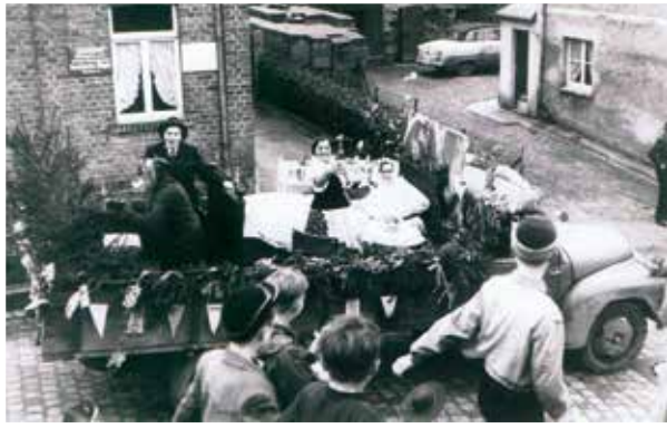
Ringstr. 17 und 19, damals noch Hauptstraße.