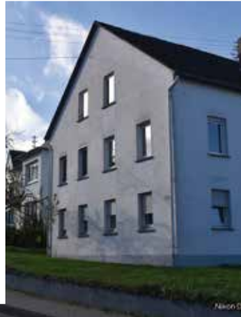
Hauptstr. 27, 29 und 31. Heute Familie Krämer