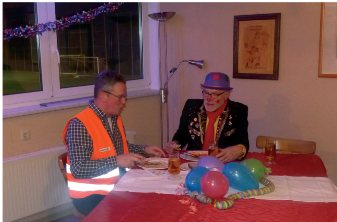
Zwei aktive bei der Nachbesprechung ...

Im nächsten Jahr werden wir dann zum Karneval, und zwar am Tag vor Schwerdonnerstag wie im letzten Jahr, den 27.02.19 wieder unsere Karnevalistische Sitzung durchführen. Die Redner vom vergangenen Jahr haben wieder ihr Kommen zugesagt. Folgender Ablauf ist geplant: Ab 15.00 Uhr Kaffee und Kuchen, anschließend werden die Vorträge gehalten. Und zum Schluß gibt es wieder Schnitzel wie früher beim Hein ofm Saal. Es wäre schön wenn sich dazu wieder zahlreiche Interessierte einfinden würden. Ein entsprechender Veranstaltungshinweis erfolgt rechtzeitig.