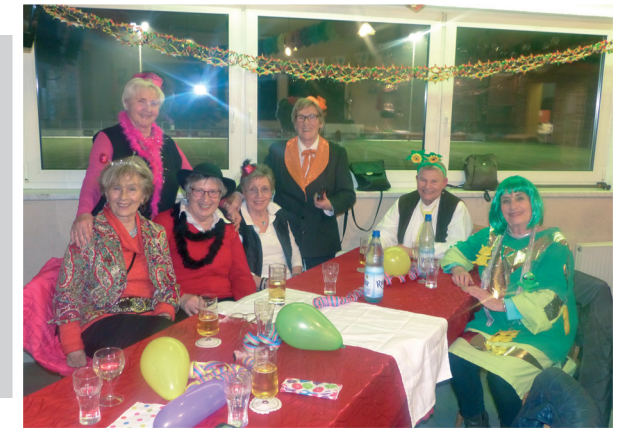
Viel Freude herrschte mal wieder beim Karnevalistischen Nachmittag im Sportlerheim