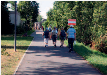
Ein Zwischenstopp wurde am Hotel an der Mosel eingelegt.

Anlässlich des 25 jährigen Jubiläums des Lauf- und Nordic-Walking-Treffs wurde im August 2015 eine Wanderung durchgeführt. Aufgrund des warmen sommerlichen Wetters fuhr die Gruppe mit dem Bus zum Schloß. Von dort aus wurde an der Mosel vorbei gewandert.