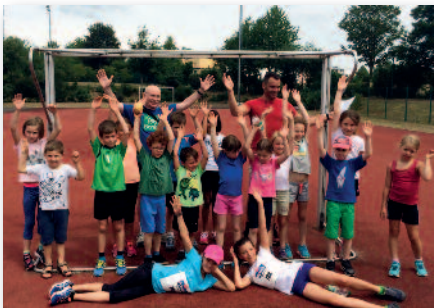
1. Bezirksmeisterschaft in Polch

So gelang unserem Kinderleichtathletik Team der U10, die bis dato nur bei Kreismeisterschaften angetreten waren, am 12.07. in Polch, bei Ihrer ersten Bezirksmeisterschaft, von 8 Mannschaften den 4. Platz zu erreichen. Auch wenn es dann doch nicht die erhoffte Bronzemedaille wurde, gaben unsere Laufmäuse alles und behaupteten sich in der Bezirksliga gegen namhafte Laufgemeinschaften wie LG Rhein-Wied und LG Koblenz.