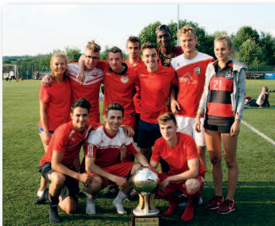
Dorfturniersieger SV Woddi Watford