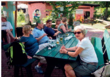
Nach einer Erholungspause ging es zum Weingut Antoniushof nach Koblenz-Moselweiß zum gemütlichen Abschluss.